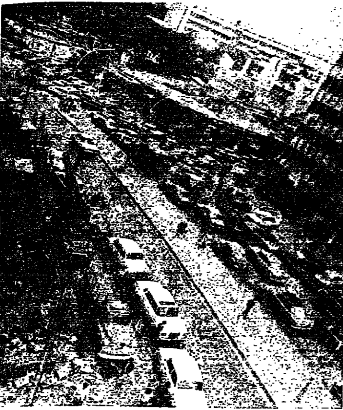
■ مقاطع الطريق : عقدة سير دائمة ■

مع الحضور الجزئي لشرطي السر ، بدأ الوضع يتحسن ، دون ان يصل الى المستوى المطلوب . فالشرطي موجود بجسده وارانته وحضارته ، ولكن بدون سلاحه القاطع وهو دفتر المحاضر .. وبغاب دفتر المحاضر مؤقتا ، سلح الشرطي بحق « تنقيس » دواليب السيارات المخالفة ، غير ان هذه الطريقة تتناول السيارات المتوقفة في المكان المنوع ، ولا نطال السائق الذي لا تطوله المراقبة والملاحشة ، الا على الحواجز وتقاطع الطرق المتقطعة ، فيحول هذه الشوارع الى مخانق للسيارات ، ومحارق لاصحابها السائقين .. فالسيرة التي تنوق الى جانب الطرق ، ضررها اقل من تلك التي « تعرض » وسط الشارع ، وان تتبرجلا شرف شيلها .. لكن وزارة الداخلية ليست غائبة عن اخلاقيات بعض السواتين ، كما قال وزير الداخلية فسي ندونسه النافذوية ، وقد يشرهم بقاتون سير جديد ، هو للسائق المخالف ، بمستوى تانون الاعداد للقاتل ..